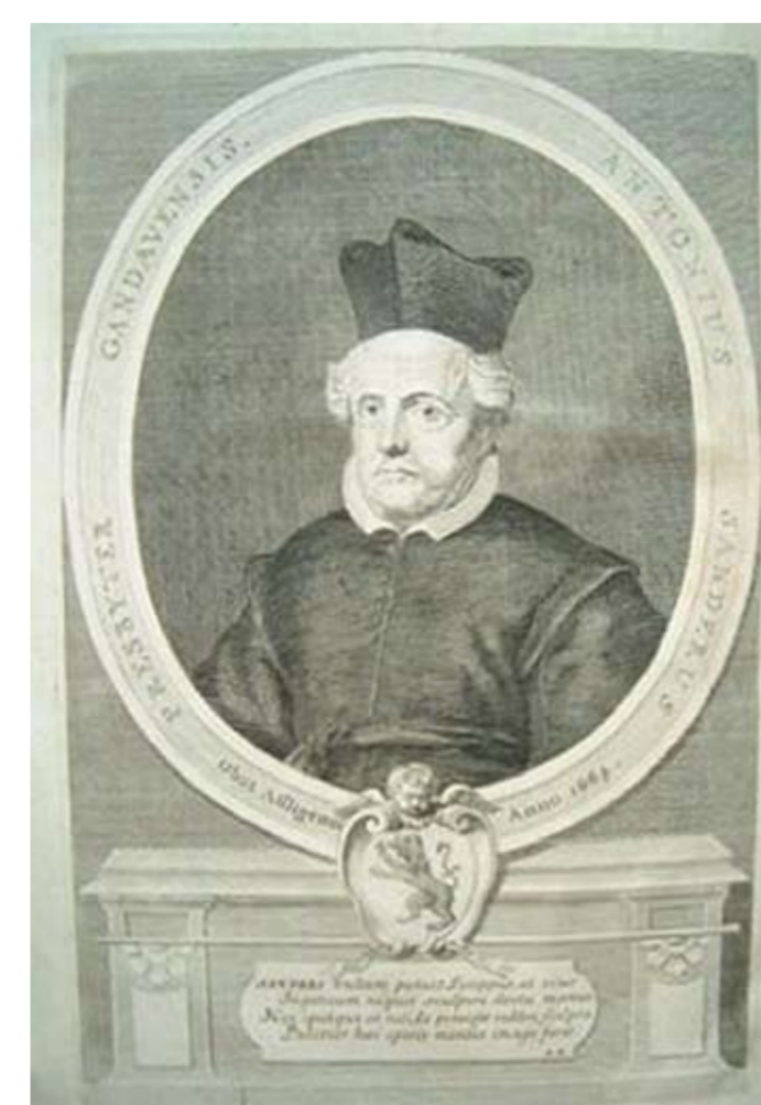
Antonius Sanderus (1586-1664), historicus, filosoof en theoloog, auteur van de 'Flandria Illustrata'