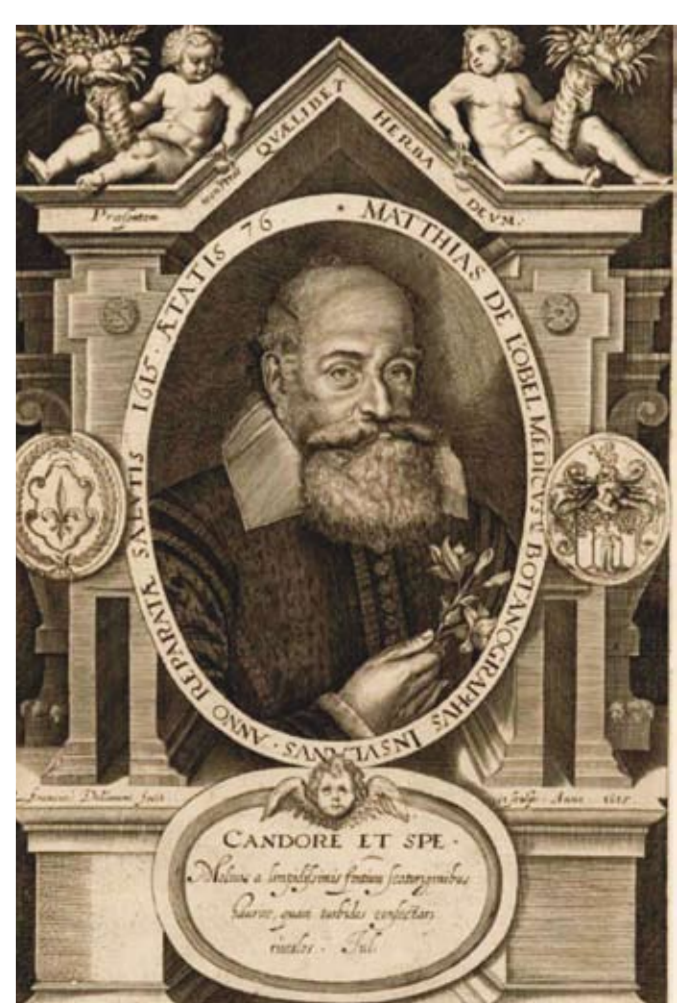
Matthias de Lobel (1538-1616) Vlaams plantkundige en arts, vooral bekend omwille van zijn Cruydenboeck (1581)