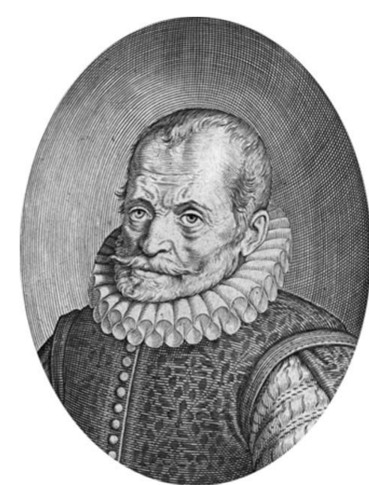
Charles de l' Ecluse ( 1526-1609), Vlaams arts, geleerde en botanicus, speelde belangrijke rol bij verspreiding van tulpen en aardappel in Europa